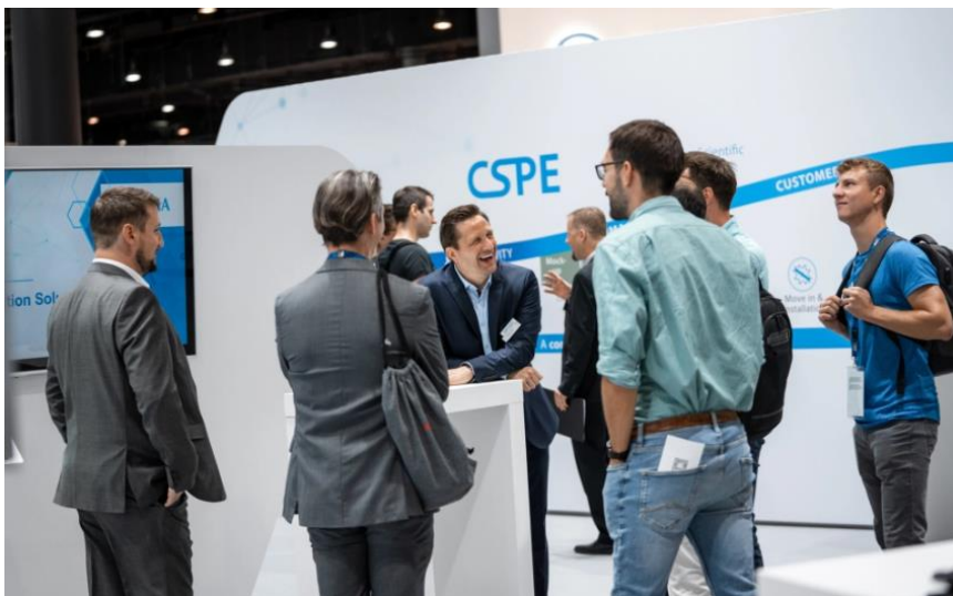
Optima präsentiert auf der ACHEMA 2024 neue Technologien für Fülllösungen, Isolatoren und Gefriertrocknung.

Optima nimmt vom 10. – 14. Juni 2024 als Aussteller auf der ACHEMA in Frankfurt am Main teil. Der Hersteller für Verpackungs- und Abfülllösungen präsentiert sich auf der Weltleitmesse für Prozessindustrie als Turnkey-Partner für integrierte Gesamtlösungen in der Pharma- und Biotech-Industrie. Besucher bekommen am Stand A73 in Halle 3.0 exklusive Einblicke in eine hochflexible MultiUse-Anlage mit Isolator, den Sterilitätstestisolator STISO für höchste Reinheit sowie den neuen Gefriertrockner LYO-SCALE für Skale-up Prozesse.