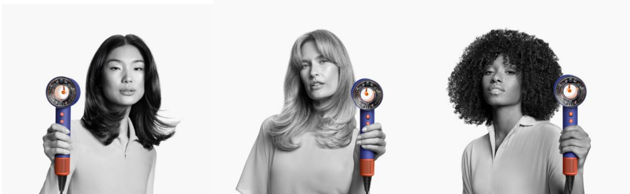
Dyson Supersonic Nural™: Mit intelligenterer Technologie für eine neue Dimension der Haarpflege

Die smarte und automatische Nural™ Sensortechnologie schützt die Kopfhaut 1 und verstärkt den natürlichen Glanz der Haare. Für ein schnelles und intelligentes Trocknen aller Haartypen ohne Hitzeschäden.