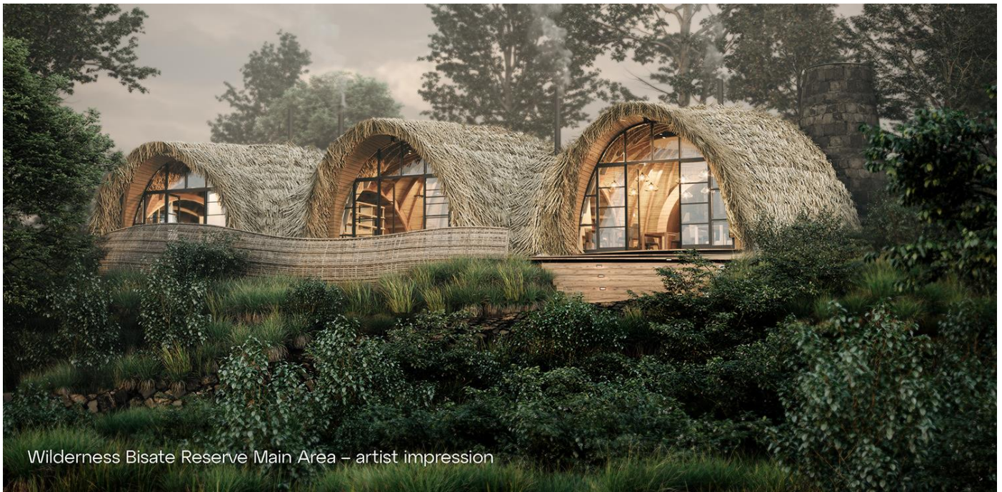
Wilderness Bisate Reserve Main Area – artist impression