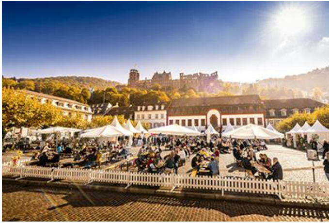
3. Heidelberger Weindorf