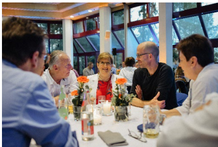
Das Workshop Wochenende bietet auch Raum zum Austausch.