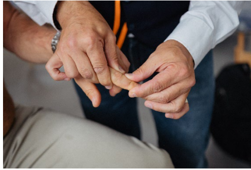
Ein Osteopath bzw. eine Osteopathin arbeitet nur mit den Händen.