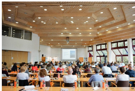
Workshop, Vortrag, Netzwerken – dafür steht das BVO Workshop Wochenende. Der Einladung des i.d.R. zweijährlich stattfindenden Fortbildungswochenendes folgen Osteopathinnen und Osteopathen aus ganz Deutschland.

Bildmaterial können Sie über den folgenden Link beziehen: