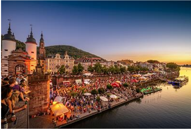
Die B37 wird wieder zur Flaniermeile