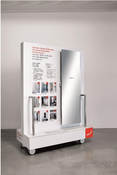
Bildquelle: Zehnder Group Deutschland GmbH, Lahr. Abdruck honorarfrei bitte unter Quellenangabe.

Motiv 8a+b: Den fünf Pop-ups im Markenerlebnisraum sind insgesamt sieben kompakte „Sidecars“ zugeordnet, die eine Vertiefung mit detailreichen technischen Exponaten bieten.