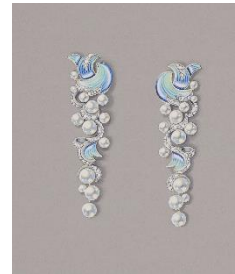
Design der maßgefertigten Schmuckstücke für die Versteigerung

MIAMI, 19. Juli 2023 – Regent Seven Seas Cruises®, eine der weltweit führenden Luxusreedereien, gab am 17. Juli bekannt, dass Sarah Fabergé, Gründungsmitglied des Fabergé Heritage Council und Urenkelin von Peter Carl Fabergé, als Taufpatin für das Schiff - A Heritage of Perfection, Seven Seas Grandeur - fungieren wird.