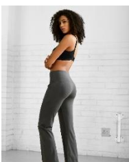
Jazzpants (ab 34,99 €) und Sport-BH (ab 39,99 €) von LASCANA ACTIVE.