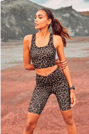
Radlerhose (ab 34,99 €) und Crop- Top (ab 26,99 €) von LASCANA ACTIVE.

Endlich ist es so weit und der Sommer ist da, perfekt um die Yoga-Session unter freiem Himmel zu genießen. Passend zu den warmen Temperaturen sind elastische Radlerhosen die richtige Wahl. Die Performance-Radlerhose von „LASCANA ACTIVE“ im stylischen Animal-Allloverprint und mit breitem Bund in V-Form ist dafür der ideale Begleiter. Kombiniert dazu das Performance-Crop-Top aus Funktionsstoff und dem sommerlichen Outdoor-Work-out steht nichts mehr im Weg.