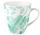
Becher 350 ml Grün EUR 9,95

Sie benötigen Muster für anstehende Fotoproduktionen bzw. Bildmaterial für Ihr nächstes Redaktionsthema? In kurzer Zeit liefert MAXWELL & WILLIAMS alles auf Ihren Tisch. Fragen Sie die gewünschten Produkte per Mail oder telefonisch an. Der Abdruck der Bilder ist honorarfrei, wenn Bezug auf den Hersteller genommen wird.