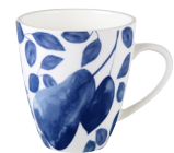
Becher 350 ml Blau EUR 9,95