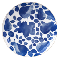
Teller 26,5 cm Blau EUR 14,95