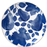
Teller 20,5 cm Blau EUR 9,95

Inspiriert vom Stilleben des berühmten französischen Malers Claude Monet, verdankt die Edition Giverny ihren Namen einer kleinen Gemeinde, dessen berühmter Garten in der Normandie liegt. Dort nämlich erlebte der Künstler milde Sommer und üppige Natur. Genuss pur, den Monet auf Leinwand bannte und wir nun auf das schöne Tafelservice aus hochwertigem Porzellan zaubern. Floral und dennoch zurückhaltend, hält diese blau-grüne Kollektion eine angenehme Balance zwischen lieblicher und gleichsam ruhiger Aquarell-Optik.