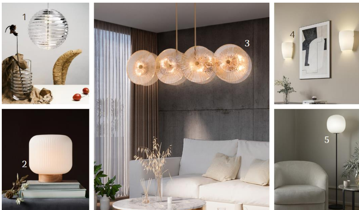
(1) Hängeleuchte Press Sphere mit gerilltem Glasschirm (9043269, Tom Dixon) | (2) Tischlampe Milford mit gerilltem Glasschirm (7006305, Nordlux) | (3) Hängeleuchte Aster aus geriffeltem Pressglas (6727542, Maytoni) | (4) Wandleuchte Vera mit gerilltem Glasschirm (9976126, Lucande) | (5) Stehleuchte Lantern mit Opalglasschirm mit besonderer Wellenstruktur (7028034, News Works) | ©Lampenwelt.de

Lichtdesigns aus Glas sind Evergreens, wenn es um edle Lichtgestaltung geht. Absolut angesagt: Schirme aus gerilltem Glas, dessen Struktur durch das warmweiße Licht erst richtig herausgearbeitet und in Szene gesetzt wird. Die Herstellungsverfahren für diese spezielle, gläserne Lichtkunst reichen vom Einsatz von Eisenformen, durch die das geschmolzene Glas geformt wird, bis zum Pressen von Glas.