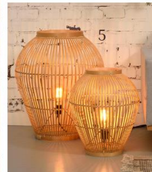
(1) Tischleuchte Arboreus aus Olivenholz (6127014, LeuchtNatur) | (2) Dreibein-Tischleuchte 2610 aus Eichenholz und Heu mit Rosenblüten (7594138, Almut von Wildheim) | (3) Wandleuchte Marrakech aus Leinen, Bast und Metall (6735135, Market Set) | (4) Tischleuchte Pura mit Schirm aus Gummibaumblättern (6127129, LeuchtNatur) | (5) Stehleuchte Tuvalu aus naturfarbenem Bambus (5046075, Good & Mojo)