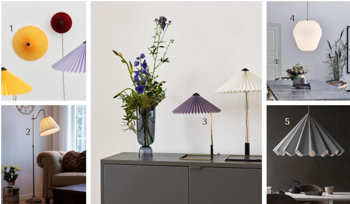
(1) Deckenleuchte Matin mit rundem Plisseeschirm aus Baumwolle (4553020, Hay) | (2) Stehleuchte Charleston mit Plisseeschirm aus Textil (6057191, Markslöjd) | (3) Tischleuchte Matin 300 mit Plisseeschirm aus Baumwolle (4553008, Hay) | (4) Hängeleuchte The Bouquet mit plisziertem Papierschirm (6086215, Le Klint) | (5) Hängeleuchte Dancing aus Filz (6731058, Menu)

Ganz gleich, ob Papier oder Textil – in Falten gelegt sehen diese Materialien anmutig und filigran aus. Als Lampenschirm durchflutet von warmweißem Licht wirkt die Hommage an den Faltenrock einladend warm und überaus gemütlich. Das i-Tüpfelchen des herbstlichen Trend-Must-haves ist seine Farbgebung. Während Plissee in warmen Beige-Tönen immer funktioniert, kommt mit frischen Farben wie Gelb, Rot und Violett eine fröhliche Note hinzu. So kann der Herbst kommen!