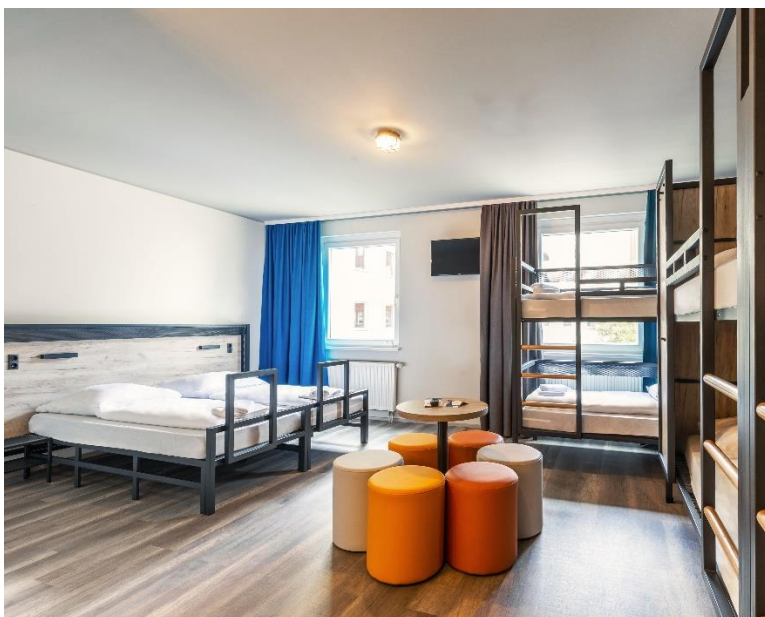
Typisches a&o-Familienzimmer: Doppel- und Etagenbetten und viel Platz für die ganze Familie (Foto: a&o).

Mehr zur Studie: https://servicevalue.de/ranking/die-besten-fuer-familien/