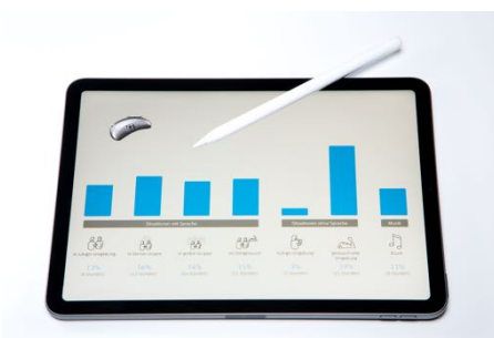
Hörtyp-Bestimmung mit dem ias Sensor