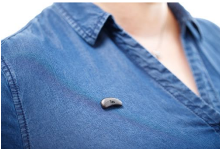
der ias Sensor

Die 2015 gegründete Individual Akustiker Service GmbH (IAS) ist eine Servicegesellschaft für inhabergeführte Hörakustikbetriebe. Die IAS unterstützt diese Betriebe mit vielfältigen Leistungen wie gemeinschaftlichem Einkauf, strategischem Marketing, Beratungs- und Schulungsangeboten sowie Existengründer-Coaching. Zugleich dient die Gemeinschaft ihren Mitgliedern als lebendige Plattform für Information und gegenseitigen Austausch. Derzeit sind mehr als 300 Hörakustik-Unternehmen mit mehr als 460 Fachgeschäften Mitglied der Gemeinschaft. Die IAS hat ihren Sitz in Kevelaer. Weitere Informationen unter: www.individualakustiker.de