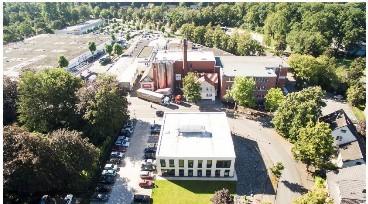
Vogelperspektive der Mestemacher GmbH in Gütersloh.

Die Gütersloher Mestemacher-Gruppe ist ein in über 87 Ländern vertretener Anbieter von Vollkornbrot und internationalen Brotspezialitäten. Das Unternehmen wurde 1871 als Stadtbäckerei gegründet. Heute umfasst die Mestemacher-Gruppe vier Betriebe und beschäftigt 667 Mitarbeiterinnen und Mitarbeiter. Der Netto-Umsatz im Jahr 2021 betrug 152,00 Millionen Euro. Seit 1994 engagiert sich die Mestemacher GmbH für die Förderung der Gleichstellung von Frau und Mann und die Vereinbarkeit von Beruf und Familie.