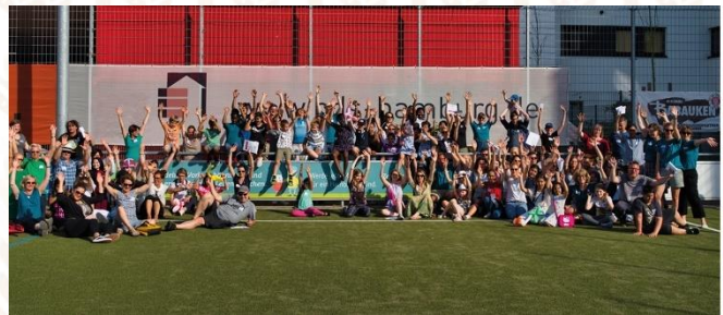
Das Bild ist entstanden vor Corona-Zeiten.

Der Verein bringt benachteiligte Kinder und Jugendliche aus Hamburg mit ehrenamtlichen Mentoren zusammen, die bei Alltagsthemen sowie bei der Schul- und Berufswahl unterstützen.