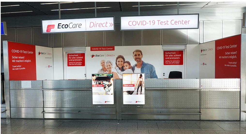
Test an Flughafen