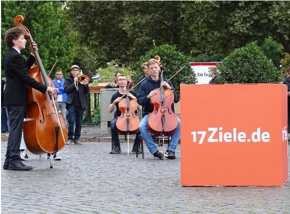
Impressionen vom 17Ziele Freude-Flash in Erfurt