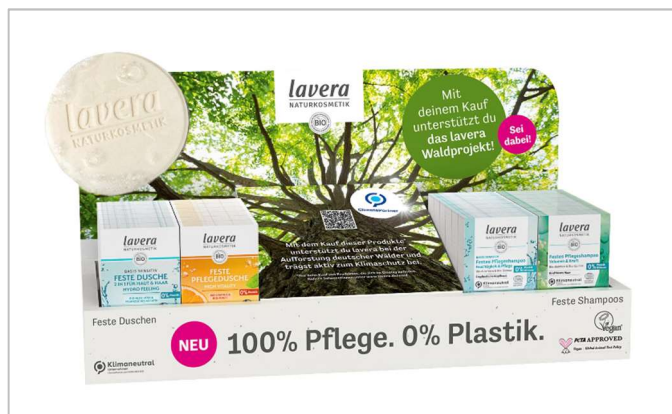
lavera dona 10 centesimi per ogni prodotto venduto, aiutando così le foreste che si trovano in una situazione di emergenza