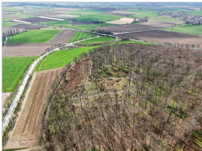
lavera è impegnata a rimboschire 15.000 m 2 di foresta intorno al castello di Marienburg