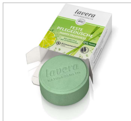
lavera Naturkosmetik cura e protegge la natura. Per lavera la sostenibilità e la tutela del clima sono principi imprescindibili, da salvaguardare già durante la concezione del prodotto e la produzione