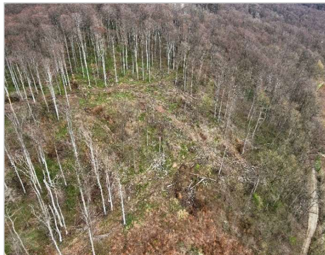
Nell'autunno del 2021 lavera planterà circa 15.000 nuove latifoglie intorno al castello di Marienburg a Nordstemmen