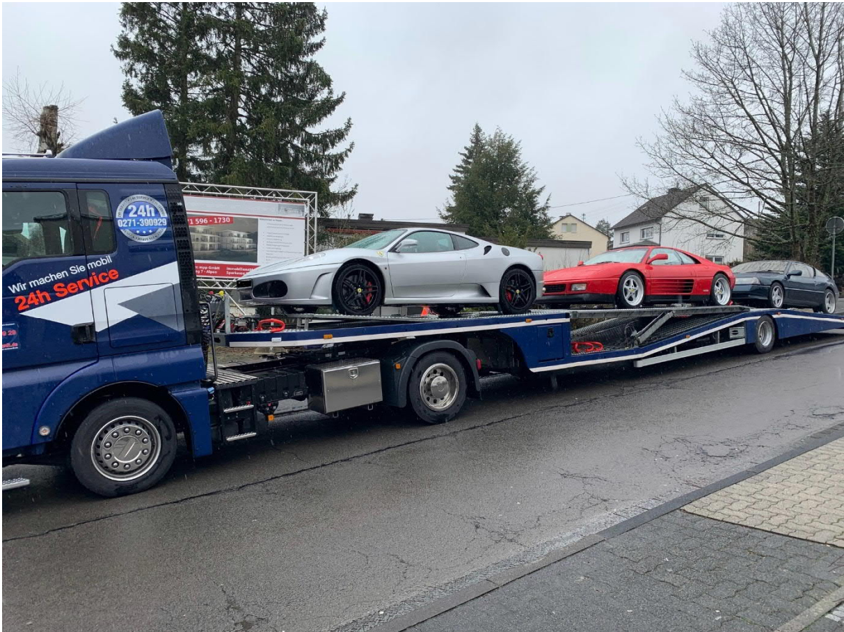
Beschlagnahmte Fahrzeuge