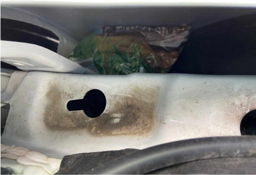
Foto: Rauschgiftversteck Motorraum