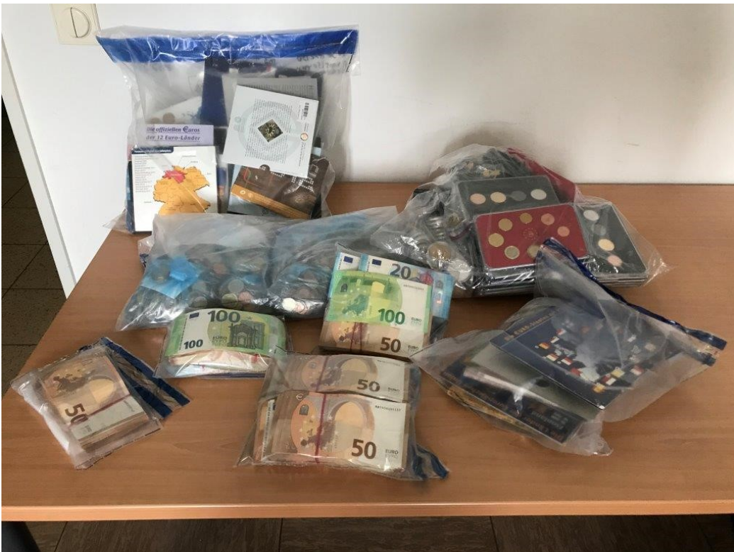
Foto: sichergestelltes Bargeld/ Goldmünzen