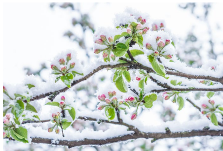
Aprilwetter: Nach der Rekordwärme in der vergangenen Woche ist der Winter mit Schnee und Frost zurückgekehrt.