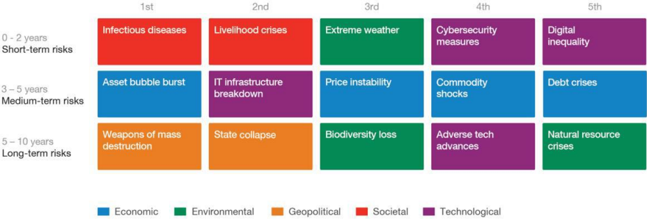
Source: World Economic Forum Global Risks Report 2021