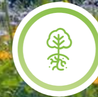
Weisheit der Gärten