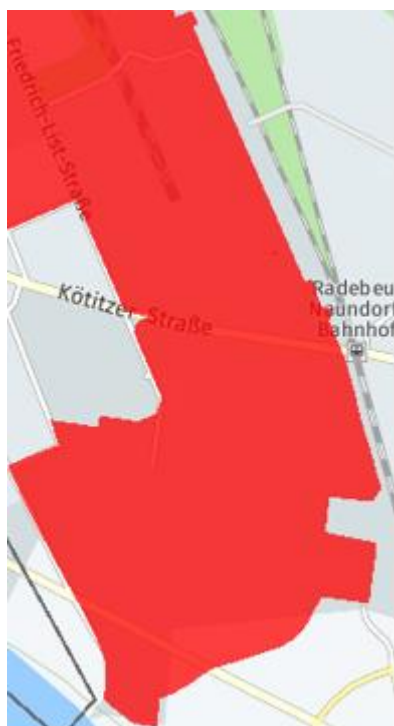
Ausbaukarte der Stadt