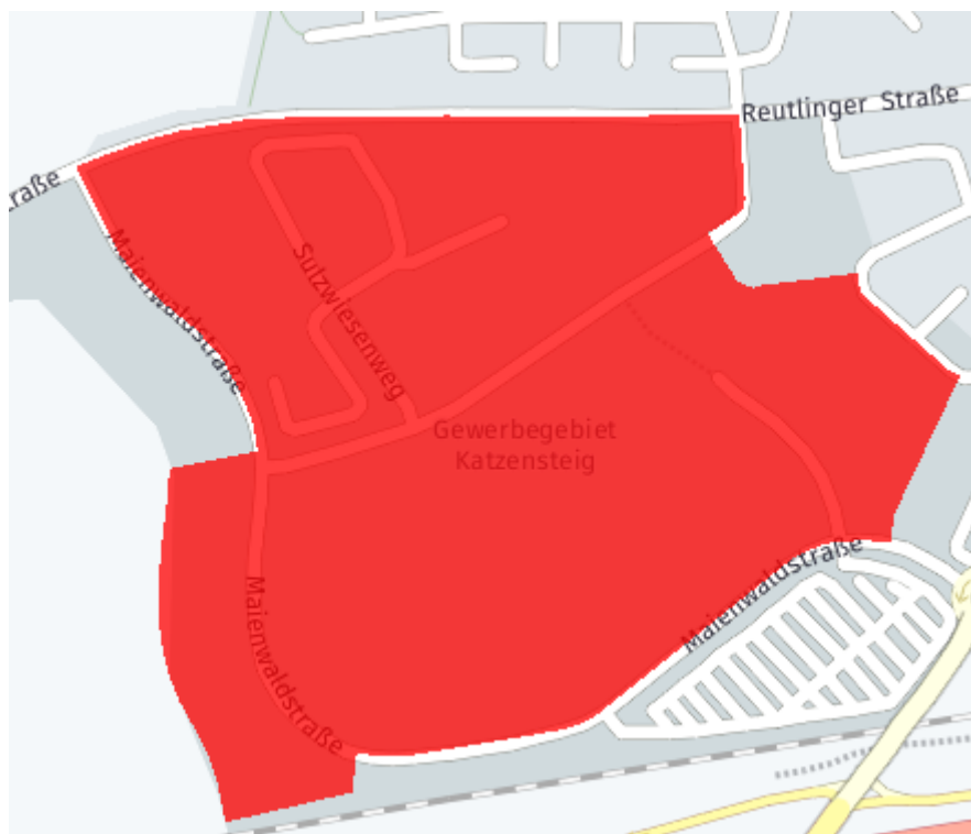
Ausbaukarte der Stadt