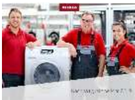
Foto 1: Miele veröffentlicht seinen Nachhaltigkeitsbericht 2019 auf www.miele.com/nachhaltigkeit .

Download Text und Foto: www.miele-presse.de