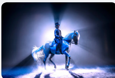
Dressurkür der Equipe Valença