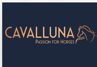
CAVALLUNA-Logo als PNG