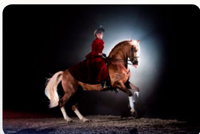
Die rote Reiterin weist Tahin den Weg