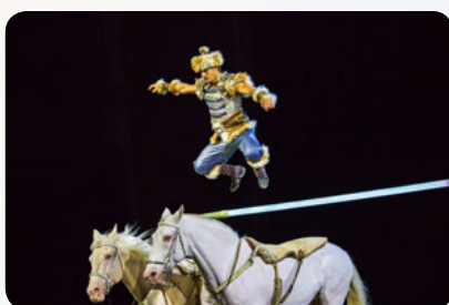
Ungarische Post von Laury Tisseur