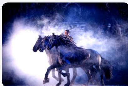
Freiheitsdressur mit Friesen