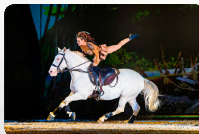
Trickreiter der Hasta Luego Academy