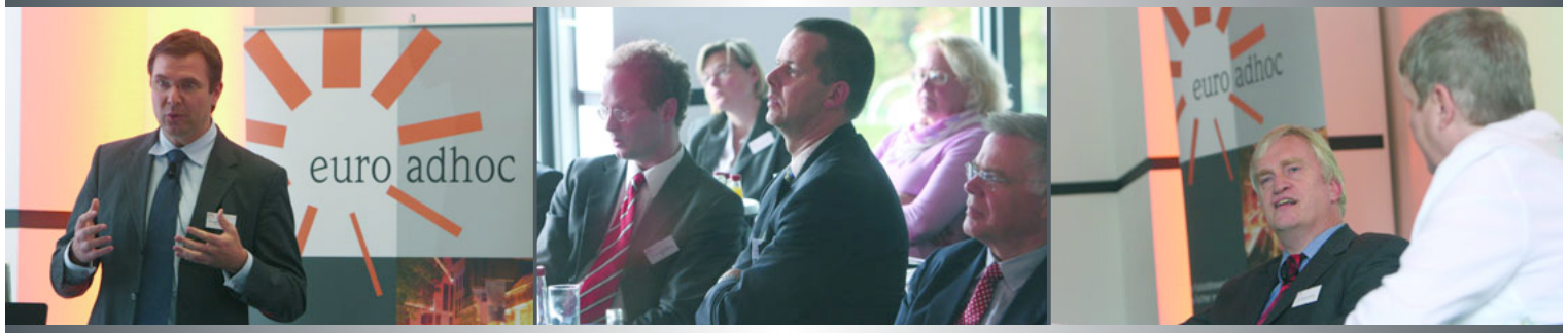
Referenten und Gäste beim IR-Forum im Oktober 2007