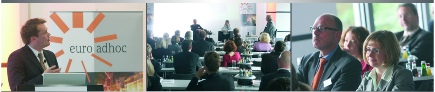
Referenten und Gäste beim IR-Forum im Oktober 2007

Subprime-Krise oder veränderte Förderungsbedingungen für regenerative Energien: Makroökonomische Entwicklungen überlagern immer wieder das betriebswirtschaftliche Einzelergebnis. Kann die Wahrnehmung am Markt mithilfe von Corporate News verbessert werden? Wie bereiten sich IR-Teams strategisch auf Krisen vor, und wie gehen sie mit dem Unvorhersehbaren in der konkreten Situation um?