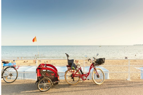
Radfahren in der Bucht von La Baule.