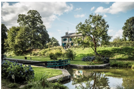
Schleuse in der Bretagne bei Hédé-Bazouges.