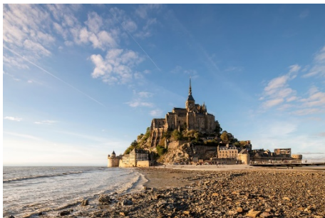
Der Klosterberg Mont-Saint-Michel und seine Bucht, Finale des Radwegs „Moderne Reise durch ein altes Land“.