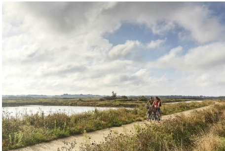
Radfahren nördlich von Saint-Nazaire durch die Guérande von Saint Molf bis Asserac.