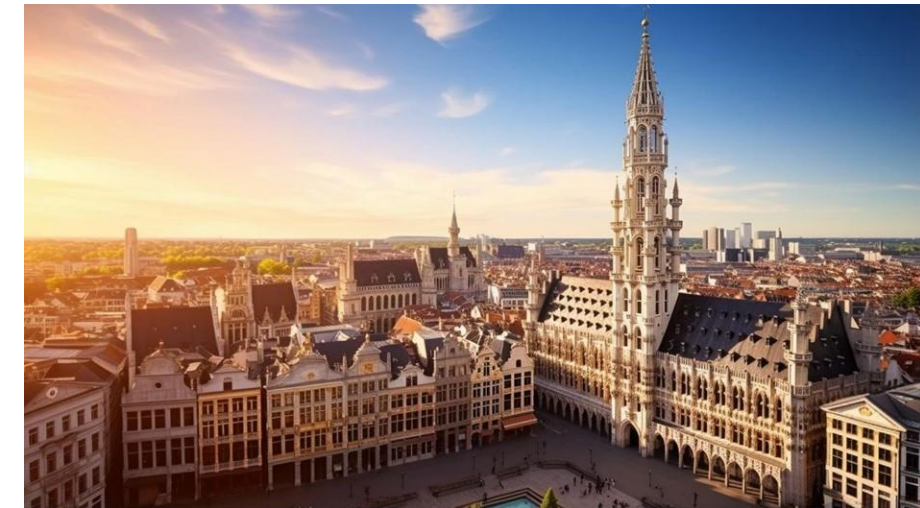
Adagio Access Brussels – Airport

5 Renovierungsprojekte: Damit es in allen Aparthotels ein einheitliches, hochwertiges und qualitativ hochwertiges Angebot gibt, das mit einem praktischen wie modernem Erlebnis verbunden ist. Wobei das Design immer von der lokalen Kultur der Destination inspiriert ist.