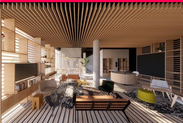
Adagio Original Heidelberg