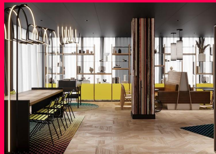
Adagio Access Rouen – Centre