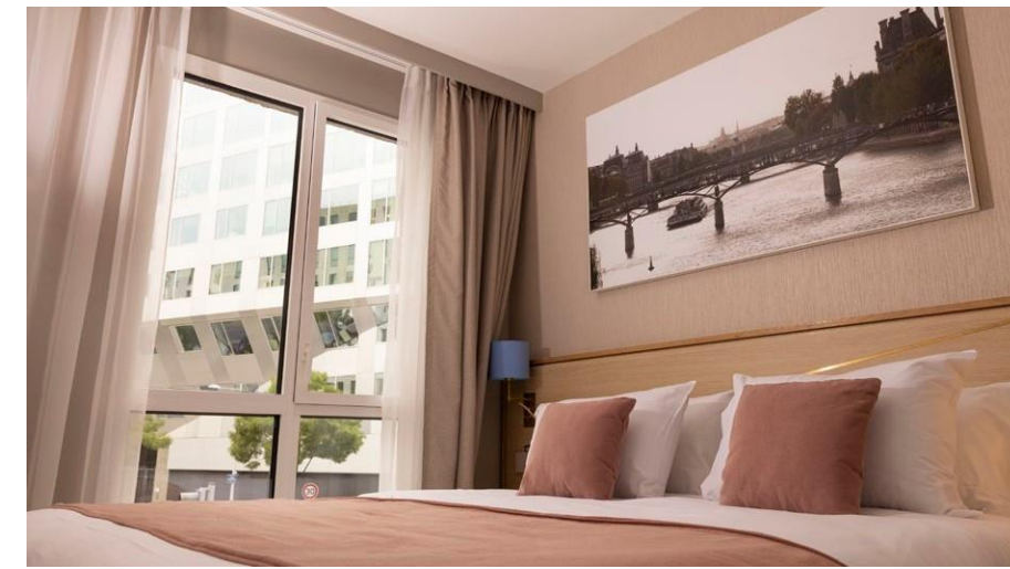
Adagio Original Boulogne-Billancourt Kermen