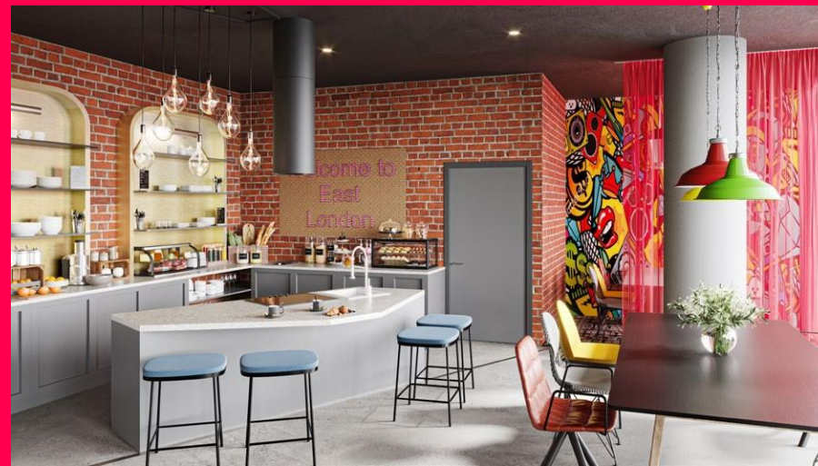
Adagio Original London – Whitechapel