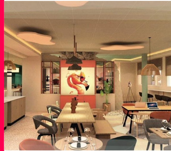
Adagio Original Porte de Camargue