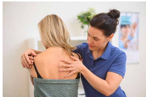
Fast 100% Weiterempfehlungsquote: Häufig suchen laut einer Patientenumfrage Betroffene einen Osteopathen bzw. eine Osteopathin auf, wenn der Rücken sie plagt. Das gilt auch und insbesondere für Schwangere.

Bildmaterial können Sie über den folgenden Link beziehen: