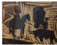
ARTIST: Picasso TITLE: Antes de picar al toro DATE: 1959 - 1961 MEDIUM: Linocut SIZE: 7.000 x 10.500 in SIDEMARK: ART-DKS-FZ4-PR7-03.B LOCATION: Art at Prime 07 free standing wall