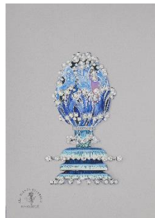
“Journey in Jewels”