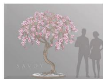
ARTIST: Savoy Studios TITLE: Bonsai Cherry Tree Sculpture DATE: 2020 MEDIUM: Bronze and handblown glass SIZE: 2000 x 1500 SIDEMARK: ART-DKS-FZ4-PR4-001 LOCATION: Sculpture at Pacific Rim entry vestibule Concept rendering