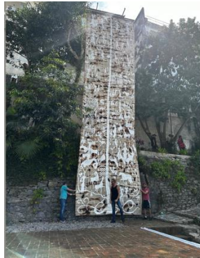
ARTIST: Walter Goldfarb TITLE: The Enchanted Tree DATE: 2023 MEDIUM: Tapestry of wool and mixed media SIZE: 12629 x 3450 SIDEMARK: ART-DK6-FZ2-ATR-29 LOCATION: Art at Deck 06 – 11 panoramic elevator wall