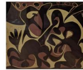
ARTIST: Picasso TITLE: Picador picando al toro, con matador al quite DATE: 1959 - 1961 MEDIUM: Linocut SIZE: 13 x 10.500 in SIDEMARK: ART-DKS-FZ4-PR7-03.C LOCATION: Art at Prime 07 free standing wall