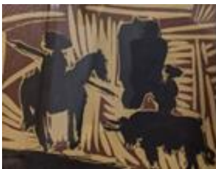
“Antes de picar al toro” Pablo Picasso

Eine neue digitale Kunsttour wird Kunstliebhaber verzaubern