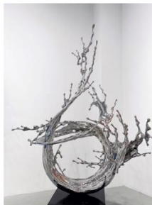
ARTIST: Zheng Lu TITLE: Water in Dripping - Waterfall DATE: 2021 MEDIUM: Stainless steel SIZE: 2050 x 7620 SIDEMARK: ART-DK5-FZ4-SPA-11 LOCATION: Art at Deck 05 Spa stairs

Die neue Regent Mobile App kann ab Dezember 2023 im App Store und bei Google Play heruntergeladen werden und bietet Gästen, die an Bord der Seven Seas Grandeur sind, unter anderem exklusiven Zugang zur „Art Experience“.