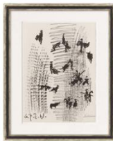
ARTIST: Picasso TITLE: Toros y Toreros DATE: 1961 MEDIUM: Lithograph SIZE: 14.500 x 10.450 in SIDEMARK: ART-DKS-FZ4-PR7-03.A LOCATION: Art at Prime 07 free standing wall