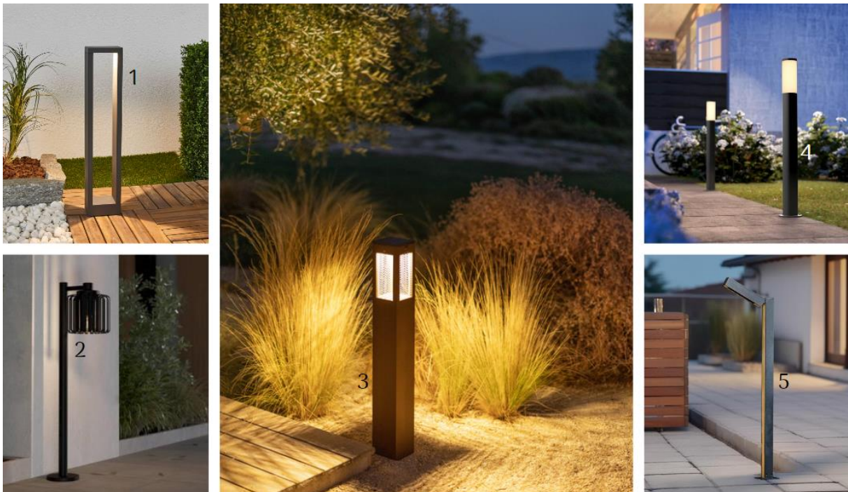
(1) LED-Wegelampe Jupp (10013760, Lucande) | (2) Wegeleuchte Selinus (10015319, Eglo) | (3) LED-Solar-Wegeleuchte Tradition (10010087, Les Jardins) | (4) Wegeleuchte Utrecht (10013843, Philips) | (5) LED-Wegeleuchte Taskalin (5257016, Lucande)

Ein gleichsam funktionaler und stilvoller Wegweiser durch den eigenen Garten ist die Wegebeleuchtung. Fest verankert oder auch per Erdspieß platziert säumen die praktischen Leuchten mit Bewegungsmelder Wege, Zufahrten, Terrassen und Vorgärten. Witterungsbeständige Materialien sorgen für eine lange Lebensdauer, während die immer facettenreicheren und moderneren Designs das Gesamterscheinungsbild von Haus und Grundstück aufwerten.