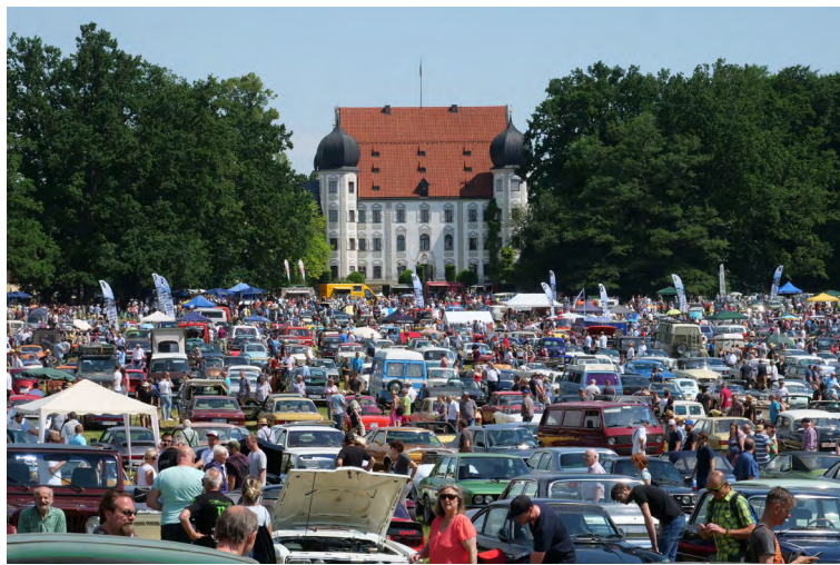
Die Schlosswiese in Maxlrain bei Bad Aibling wird am Fronleichnamsdonnerstag, 8. Juni, wieder zum Mekka für Oldtimerfans.