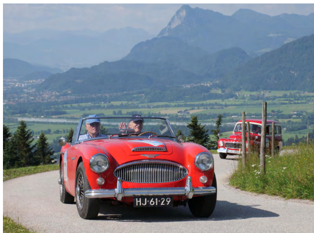
Bayerns Traumkulisse im Oldtimer genießen – so lautet das Motto der ADAC Bavaria Historic.

Am Freitag, 9. Juni, nehmen die Teams die 300 Kilometer lange Karwendel-Etappe unter die Räder. Am Abend startet die von der AIB-KUR organisierte Oldie Night vor der Ausstellungshalle in Bad Aibling, in deren Rahmen die Teilnehmerfahrzeuge präsentiert werden. Ab 17 Uhr rockt DJ Roxy die Party mit den großen Hits und Schlagern der 60er bis 80er Jahre. Ab 20 Uhr haucht die Münchner Band „Teddy und die Lollipops“ ihren Idolen wie Ted Herold oder Peter Kraus wieder Leben ein. Viele Besucher erscheinen zur Oldie Night in Kleidern der 50's und 60's. Am Samstag, 10. Juni, dürfen sich die Bavaria Historic-Teams auf das Fünfseenland zwischen Starnberger See und Ammersee freuen. Die Zielankunft ist ab 15.45 Uhr vor dem Kurhaus Bad Aibling, wo die Entscheidung um den „Preis der ADAC Classic-Car-Versicherung“ fällt. Am Abend steigt die „Night of the Champions“ im Kesselhaus in Kolbermoor mit den Pokalen aus den Händen der Caritas Wendelstein Werkstätten in Raubling. Diese Behindertenwerkstätte und der ADAC Südbayern bauen ihre erfolgreiche Kooperation heuer im Rahmen der ADAC Bavaria Historic und des Maxlrainer Oldie Feelings weiter aus.