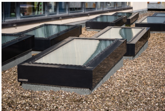
LAMILUX Brandschutz Flachdach Fenster Fire Resistance REI 90