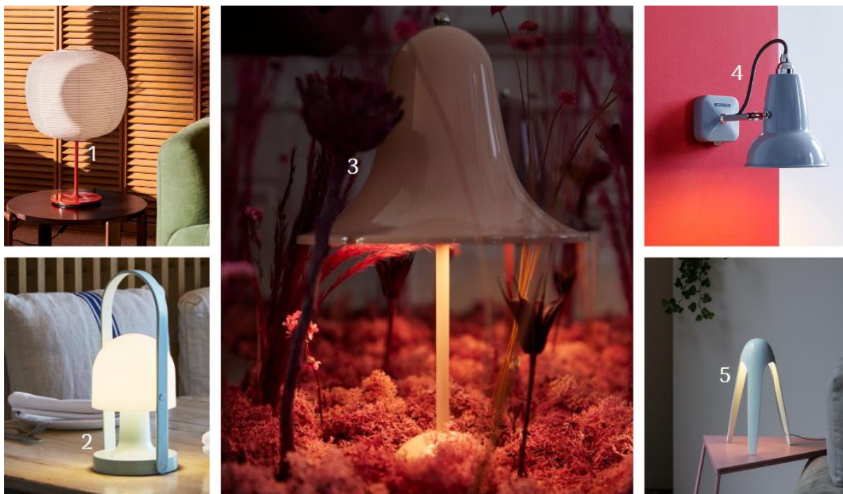
(1) Tischleuchte Common mit Schirm Peach aus Reispapier (10003277, Hay) | (2) LED-Akku-Tischleuchte FollowMe (6739111, Marset) | (3) Tischlampe Pantop portable (10004610, Verpan) | (4) Wandlampe Original 1227 Mini (1073091, Anglepoise®) | (5) Tischleuchte Cyborg (6705129, Martinelli Luce)

Auf zarte Rosé- und Blautöne, die an den Frühling erinnern, stößt Viva Magenta mit Pale Dogwood und Plein Air . So wird das Interieur von einer betont verspielten und femininen Note erfüllt bei gleichzeitiger Besinnung auf puristische geometrische Grundformen – die Kontraste ziehen sich damit durch die Trend-Farbwelt für 2023. Auch hier gilt: Ob die Leuchte selbst mehrere Farbtöne vereint oder sich kontrastreich von Wand, Tisch oder Chaiselongue abhebt, ist zweitrangig. Hauptsache die Farbwirkung kommt in Verbindung mit warmem Wohlfühllicht zum Tragen.