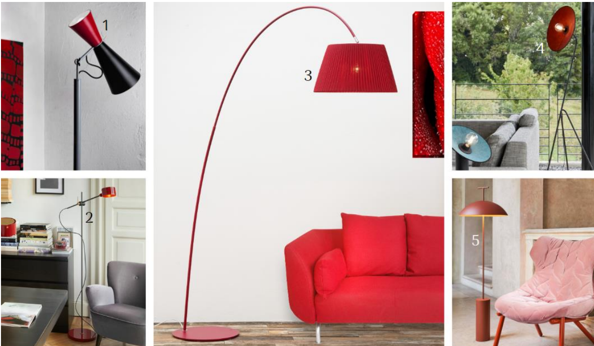
(1) Stehleuchte Parliament (7024110, Nemo) | (2) Stehleuchte G.O. 352 (10004881, Oluce) | (3) Bogen-Stehleuchte Marion (6059425, Lam) | (4) Stehleuchte Gatsby (6735070, Market Set) | (5) Stehleuchte Geen-A mit Tragegriff (5541139, Kartell)

Wenn ihre extravagante Statur sie nicht bereits zum Eyecatcher im Raum macht, dann spätestens der satte Rotton, den sie stolz präsentieren. Stehleuchten in allen Nuancen rund um Viva Magenta bringen Abwechslung und Offenheit ins Interieur, brechen mit so mancher Konvention und sorgen damit für Freude und Aufgeschlossenheit. Das warmweiße Licht, das sie gelenkt von großen Schirmen oder auch direkt strahlend in den Raum abgeben, macht ihren leuchtenden Auftritt perfekt.