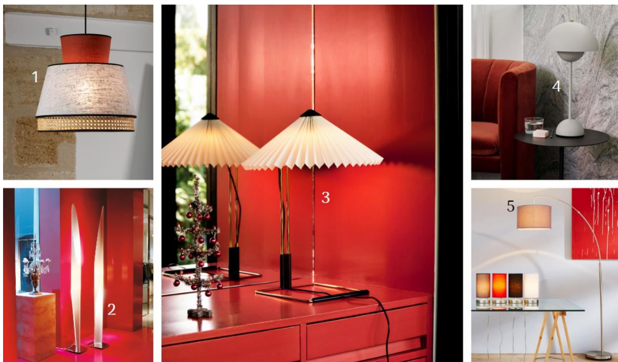
(1) Pendellampe Singapour M (6735057, Market Set) | (2) Stehleuchte Shakti aus Plexiglas (5520024, Kundalini) | (3) Tischleuchte Matin 300 mit Plisseeschirm (4553010, Hay) | (4) Tischleuchte Flowerpot (1076025, &tradition®) | (5) Bogenleuchte Clarie (1508799, Brilliant)

Viva Magenta wirkt für sich, aber auch in Kombination mit anderen Farbtönen. Welche dem satten Rot am besten schmeicheln, hat das Pantone Color Institute zusammengestellt. In eine helle Range von Grau bis Beige gehen die Farbtöne Gray Lilac und Gray Sand . In Kontrast zu diesen Nuancen kann Viva Magenta seine Dynamik eindrucksvoll entfalten. Dabei kann die Leuchte selbst in Sand- und Cremetönen daherkommen und sich von einer roten Wand, einem roten Sofa oder einem roten Print absetzen. Umgekehrt ist auch eine magentafarbene Leuchte vor einem grauen oder eierschalenfarbenen Ambiente ein Hingucker.