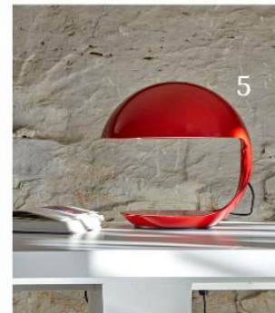
(1) Tischleuchte Binic (3560562, Foscarini) | (2) Tischleuchte Parasol (5035113, Innermost) | (3) Tischleuchte LBM (10003209, Hay) | (4) Tischleuchte Glam (7592216, Prandina) | (5) Tischleuchte Cobra mit drehbarem Kopf (6705222, Martinelli Luce)