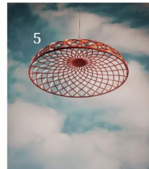
(1) Glas-Pendelleuchte La Belle S5 (7592111, Prandina) | (2) Holz-Pendelleuchte Maruja (6048572, LZF Lamps) | (3) Keramik-Hängelampe Ayrton (3517279, Ferroluce) | (4) Filz-Hängeleuchte LARAfelt S (2600565, Domus) | (5) Hängeleuchte Skynest mit Netzstruktur (10008922, FLOS)