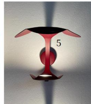
(1) Wandleuchte X-Club mit umlaufendem Holzfurnier-Band (6048476, LZF Lamps) | (2) Wandleuchte Living Elegant (6528028, Menzel) | (3) Wandleuchte Loft D2501 (5253061, Jieldé) | (4) Wandleuchte Binta aus Stoff (9639435, Lucande) | (5) Wandleuchte Le Gigine (5538179, Knikerboker)