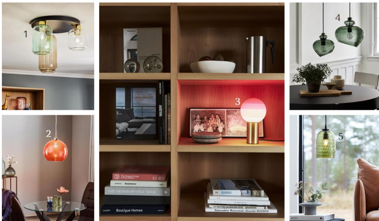
(1) Deckenleuchte Marco (9050308, Euluna) | (2) Hängeleuchte Colour (8544107, Euluna) | (3) LED-Tischleuchte Dipping Light (6739021, Marset) | (4) Hängeleuchte Grace (3574032, Frandsen) | (5) Hängeleuchte Gabby (10000657, PR Home) | ©Lampenwelt

Glasschirme in zarten Bonbontönen geben dem Vintage-Flair eine fröhliche Note und sorgen für Individualität im Interieur. Je nach Transluzenz präsentieren die bunten Blickfänge nostalgische Filamentleuchtmittel in ihrem Innern. In Sachen Formgebung und Musterung ist alles erlaubt: von gerillter Haptik bis zu glatter Oberfläche, von Kugel bis Zylinder. Tipp: Die farbenfrohen Vintage-Glasschirme lassen sich auch sehr gut im Boho-Ambiente unterbringen.