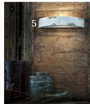
(1) Hängeleuchte Giorgia (3517152, Ferroluce) | (2) Pendelleuchte C1620 (3517246, Ferroluce) | (3) Tischlampe Nilaska (9921003, Lindby) | (4) Hängelampe Heart (8510519, Sil-Lux) | (5) Wandleuchte C603 (3517140, Ferroluce)