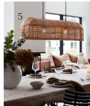
(1) Hängeleuchte Torina (10003799, Nordlux) | (2) Tischleuchte Treccia (8603256, Euluna) | (3) Hängeleuchte Ayesgarth (10001798, Eglo) | (4) Hängeleuchte Boho (2616207, Euluna) | (5) Hängeleuchte Wickham (10000663, PR Home) | @Lampenwelt