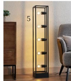
(1) Hängeleuchte Original 1227 Brass Midi (1073192, Anglepoise®) | (2) Stehleuchte Mesh (6055785, Lucide) | (3) Hängeleuchte Shirebrook (10001761, Eglo) | (4) Tischleuchte Punch (10002999, Reality Leuchten) | (5) Stehlampe Xamara (9628015, Lindby)