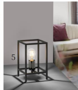
(1) Tripod-Stehlampe Vaio (9050070, Euluna) | (2) Tischleuchte Tim (7001033, Näve) | (3) Tischleuchte Uptown (7595024, PR Home) | (4) Hängeleuchte Nefeli (9628446, Lindby) | (5) Tischleuchte Fabio (6003225, Leuchten Direkt) | ©Lampenwelt