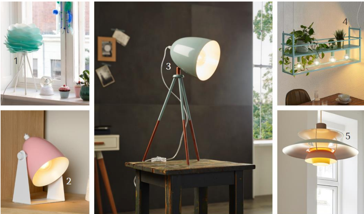
(1) Dreibein-Tischleuchte Carmina Mini (9521311, Umage) | (2) Tischleuchte Chago (6055445, Lucide) | (3) Tischleuchte Dundee (3031875, Eglo) | (4) Hängeleuchte Navin (9628545, Lindby) | (5) Hängeleuchte PH 5 Pastels (10001577, Louis Poulsen)

Wer sich im Vintage-Flair wohlfühlt, wird Lichtideen in Pastelltönen von Mint bis Rosé gerne die Türen zum Interieur öffnen. Mit massiven Retroschirmen, die sich individuell ausrichten lassen, kommen die zarten Farbnuancen ebenso zur Geltung wie in der Tripod-Gestaltung. Ein Hingucker mit Mehrwert sind Pendelleuchten, die oben Platz für Pflanzen und Kräuter bereithalten und nach unten mit nostalgischen Filamentleuchtmitteln warmes Lichtflair verbreiten.