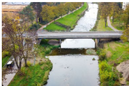
Die Brücke der L83 über die Ahr

Bei der Flutkatastrophe im Juli 2021 wurde ein Widerlager der Brücke schwer beschädigt. Das Randfeld war an seinem südlichen Auflager nicht mehr gestützt und hing stark durch. Es wurde in seine ursprüngliche Lage angehoben, um ein neues Widerlager zur Auflagerung zu schaffen. Nach nur zwei Monaten konnte die Brücke wieder für den Verkehr freigegeben werden.