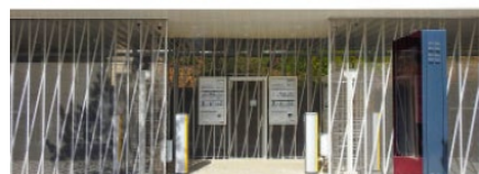
Der Fahrradspeicher am Nürnberger Bahnhof