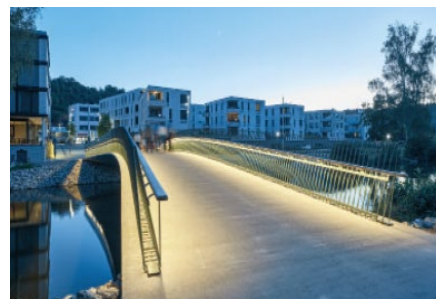
Der Herzogsteg in Eichstätt Bild: Bruno Klomfar

Der neue Herzogsteg über die Altmühl verbindet die engen Gassen der Altstadt mit der Neustadt. Der ganze Steg ist eine monolithisch gegossene Steinskulptur in der Betonfestigkeitsklasse C35/45. Das optisch ansprechende Geländer aus Stahl mit Eichenholzhandlauf und LED-Beleuchtung kann im Hochwasserfall innerhalb kurzer Zeit komplett demontiert werden.