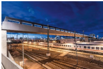
Der Arnulfsteg in München

Ende 2020 wurde der Arnulfsteg für den Fußgänger- und Radverkehr freigegeben. Die 240 Meter lange Brücke erstreckt sich zwischen Hacker- und Donnersberger Brücke über das komplette Gleisbett der Deutschen Bahn. Tragwerk, Design und einzigartige Baustellenlogistik waren herausfordernd und überzeugend.