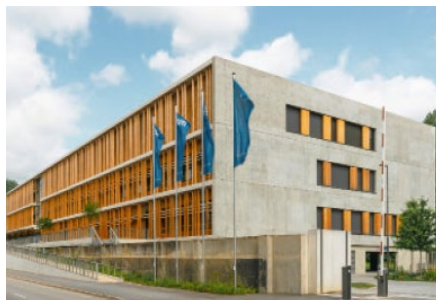
Der Campus für Nachhaltige in Straubing

Das neue Forschungsgebäude für Nachhaltige Chemie am TU-Campus Straubing wurde auf einer ehemaligen Deponie errichtet und liegt im Überflutungsbereich der Donau. Durch das Aufständern des Bauwerks wurden zwei Fliegen mit einer Klappe geschlagen: Es musste die frühere Deponie nur an wenigen Stellen geöffnet werden und die Nutzung im Hochwasserfall ist sichergestellt. Durch den Einsatz von Ultraleichtbeton wurden zwei weitere Ziele erfüllt: geringes Gewicht und gute Dämmung.