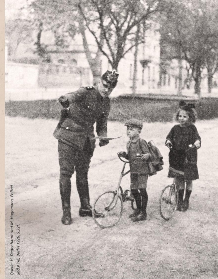
Quelle: H. Degenhardt und M. Hagemann, Polizei und Kind, Berlin 1926, S.32f.

Lernen Sie die widersprüchliche Geschichte der Polizei in der Weimarer Republik kennen. Der Schwerpunkt der Ausstellung liegt auf den Regionen des heutigen Niedersachsens. Originale Exponate aus der Sammlung des Polizeimuseums Niedersachsen laden zu einer besonderen Zeitreise ein.