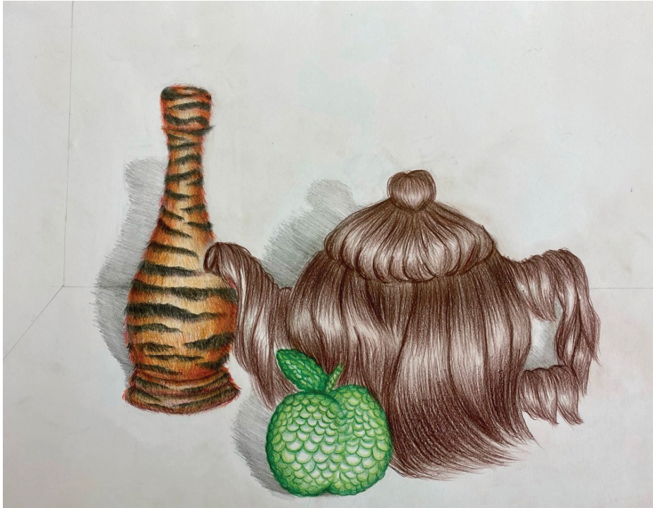
Stilleben, surrealistisch verfremdet