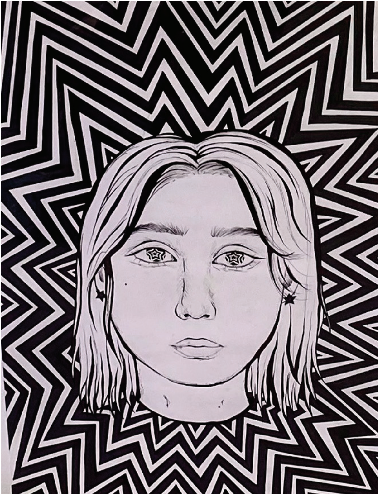
OP ART - Porträts