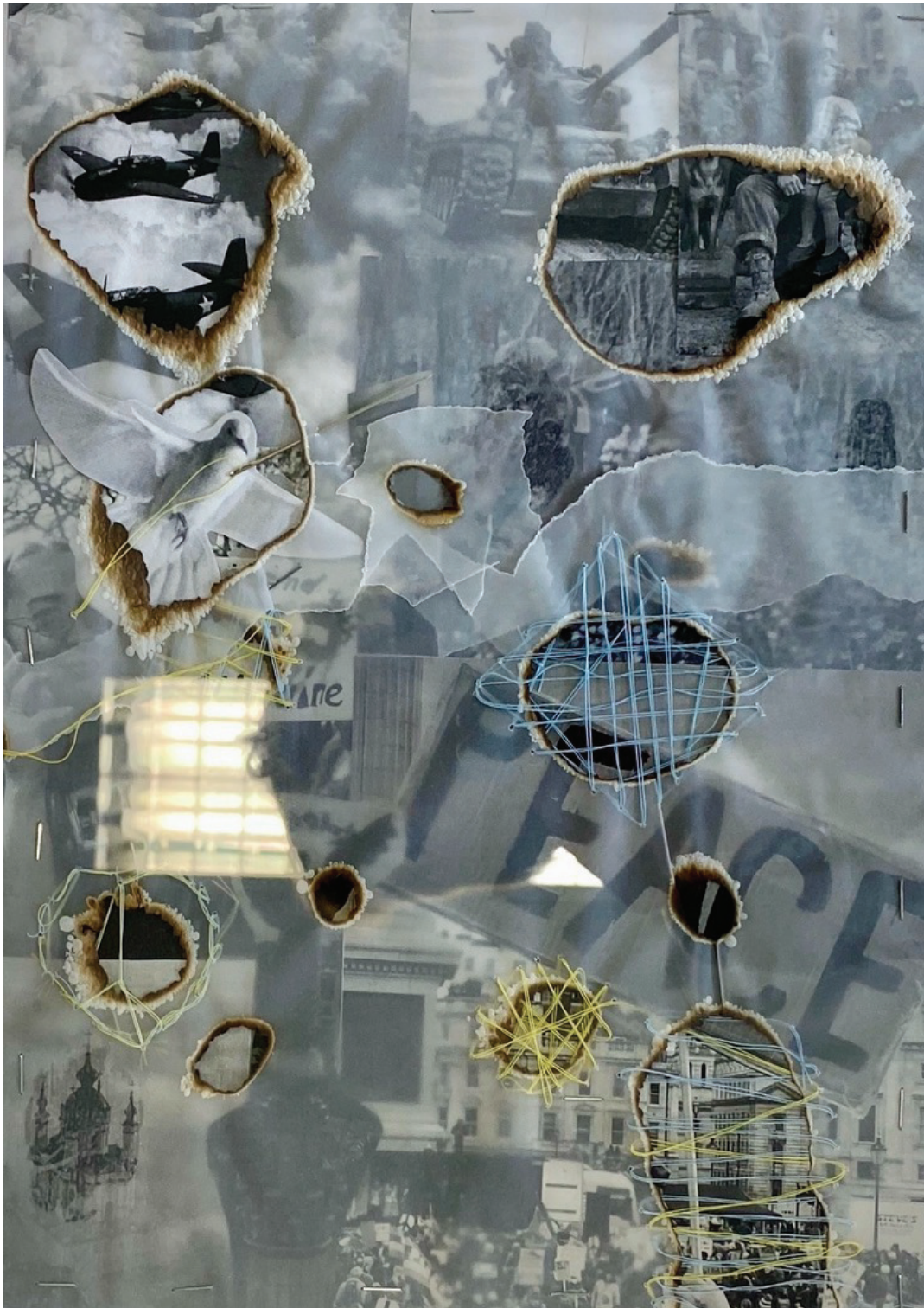
Friedenstaube – Collagetechnik