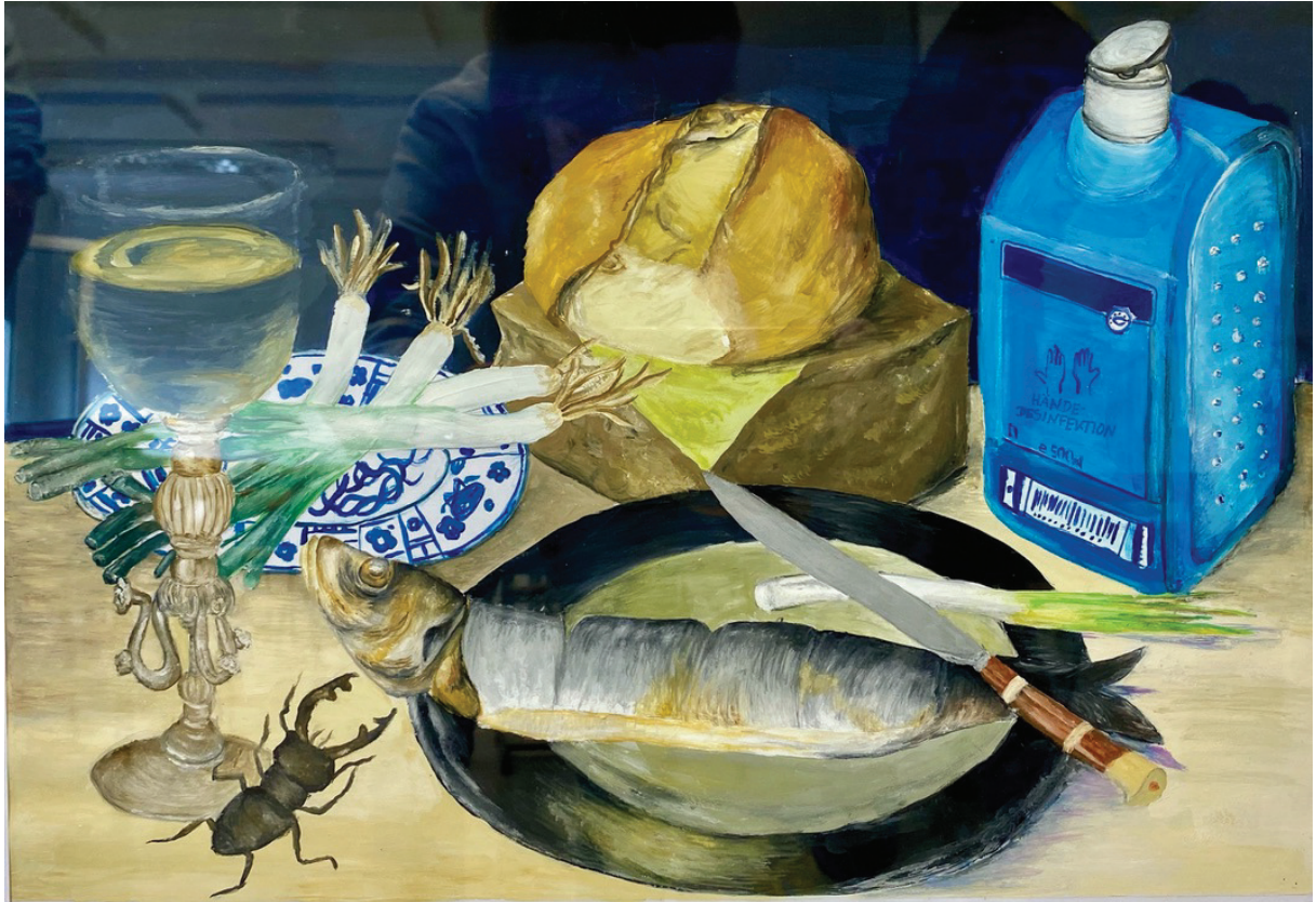
Barocke Stilleben, neu gesehen