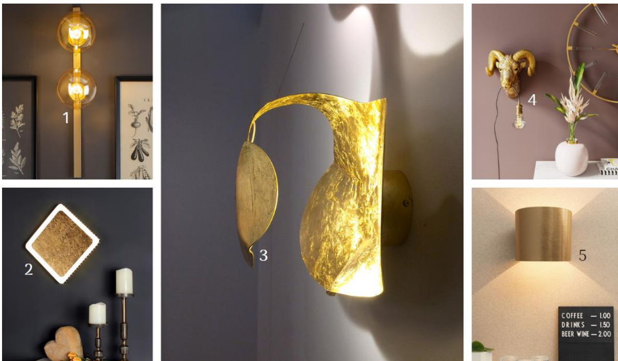
(1) Wandleuchte Neptun mit Glaskugeln in Gold (3009154, Eco-Light) | (2) Dimmbare LED-Wandleuchte Solaris (3009130, Eco-Light) | (3) Indirekt leuchtende Designer-Wandleuchte Gi.Gi (5538051, Knikerboker) | (4) Wandleuchte Animal Aries Head (5517800, Kare) | (5) Vegane Wandleuchte 1411 mit Zylinderschirm aus Ananasfasern (7594114, Almut von Wildheim) |

Wandleuchten in Gold- und Messingoptik beschenken dem Interieur einen ganz besonderen Hingucker auf Blickhöhe. Denn die Wirkung des warmweißen Lichts, das von warmen Metallic-Oberflächen reflektiert wird, ist edel und gemütlich zugleich. Die Materialkombi mit Glas bringt noch mehr extravagantes Flair mit sich, während andere Designs mit einem Augenzwinkern bestehen: Zum Beispiel Kares Wandleuchte Animal Aries Head , bei der ein Widderkopf ein Filamentleuchtmittel im Maul präsentiert. Nachhaltig wird es mit der vegan hergestellten Wandleuchte 1411 aus Ananasfasern von Almut von Wildheim.