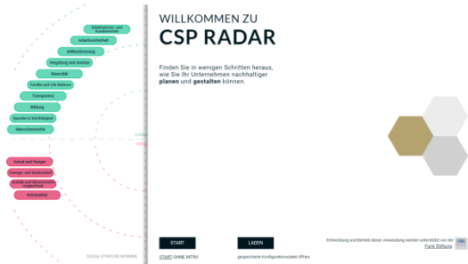
Bild 1 Startbildschirm des CSP-Radars

Bildmaterial (wird Ihnen auf Anfrage gerne hochauflösend zur Verfügung gestellt):