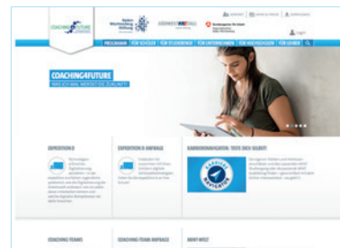
Informieren und vernetzen: www.coaching4future.de

Nicht nur für MINT-Einsteiger ist das Netzwerkportal hilfreich – auch Unternehmen profitieren davon. Sie können sich mit einem Unternehmensprofil als attraktiver Arbeitgeber präsentieren und ihre Jobangebote in die MINT-Stellenbörse einstellen. Darüber hinaus können sie jederzeit in den Profilen der registrierten Schülerinnen, Schüler und Studierenden recherchieren, interessanten Kandidatinnen und Kandidaten eine Nachricht hinterlassen und so aktiv Nachwuchstalente anwerben.