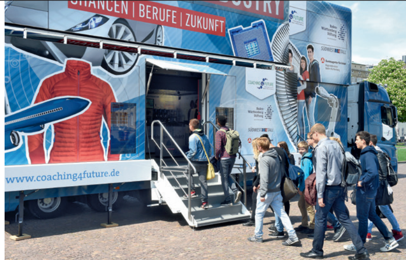
Die moderne Welt der Industrie erleben.