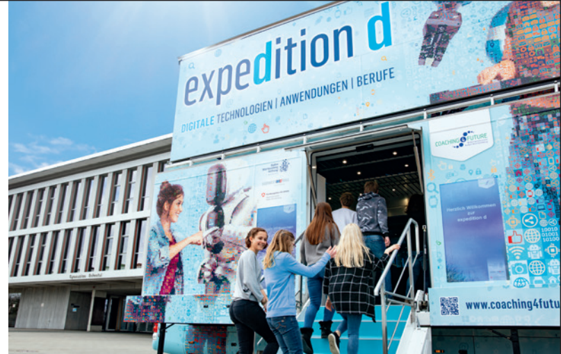
Eintauchen in die Welt der Digitalisierung.