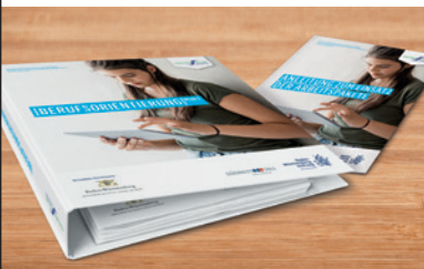
Aufbewahrungsordner und allgemeine Anleitung

Mit [Berufsorientierung] MINT – Lehr- und Lernmaterialien zur berufsorientierenden Bildung können Lehrkräfte das Erfolgskonzept von COACHING4FUTURE selbst im Unterricht einsetzen: Mit insgesamt 14 Arbeitspaketen können sie am Beispiel von spannenden Zukunftstechnologien die verschiedenen Aufgabengebiete von MINT-Berufen erarbeiten und so den Jugendlichen Lust auf entsprechende Ausbildungs- oder Studienwege machen.