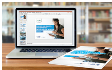
Arbeitspakete: PowerPoint-Präsentationen und Leitfäden