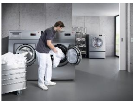
Foto 5: Waschmaschinen und Trockner der Generation „The New Benchmark Machines“ sind beispielsweise mit Spezialprogrammen für die RKI-konforme Desinfektion von Wäsche in Senioreneinrichtungen ausgestattet. (Foto: Miele)

Foto 4: Speziell für die lokale Koch- und Lebensweise in Hong Kong entwickelt: Die Gas-Module aus der SmartLine-Serie CS 7151 bzw. CS 7152 sind besonders schmal und haben gleichzeitig leistungsstarke Messingbrenner. (Foto: Miele)