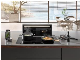
Foto 2: Die Jury honoriert die prägnante Gestaltung der Black Levantar-Dunstabzugshaube für offene Koch- und Wohnbereiche: Beim Einschalten fährt der schlanke Haubenkörper der Black Levantar in seine Arbeitsposition. (Foto: Miele)

Foto 1: Der neue Miele Triflex HX2 überzeugt mit 60 Prozent mehr Power im Vergleich zu seinem Vorgänger dank des neuen Digital Efficiency Motors, der Elektrobürste Multi Floor XXL und der Vortex-Technologie. (Foto: Miele)