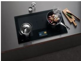
Foto 3: Das Miele-Induktionskochfeld KM 7999 FL bietet flexiblen Raum für bis zu fünf Kochgeschirre und wird über ein Touch-Display bedient. (Foto: Miele)

Foto 2: Die Jury honoriert die prägnante Gestaltung der Black Levantar-Dunstabzugshaube für offene Koch- und Wohnbereiche: Beim Einschalten fährt der schlanke Haubenkörper der Black Levantar in seine Arbeitsposition. (Foto: Miele)