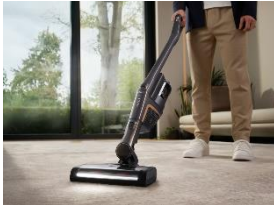
Foto 1: Der neue Miele Triflex HX2 überzeugt mit 60 Prozent mehr Power im Vergleich zu seinem Vorgänger dank des neuen Digital Efficiency Motors, der Elektrobürste Multi Floor XXL und der Vortex-Technologie.