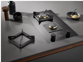
Foto 4: Speziell für die lokale Koch- und Lebensweise in Hong Kong entwickelt: Die Gas-Module aus der SmartLine-Serie CS 7151 bzw. CS 7152 sind besonders schmal und haben gleichzeitig leistungsstarke Messingbrenner. (Foto: Miele)

Foto 3: Das Miele-Induktionskochfeld KM 7999 FL bietet flexiblen Raum für bis zu fünf Kochgeschirre und wird über ein Touch-Display bedient. (Foto: Miele)