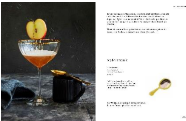
Apfeltrunk Rezept © Kathleen Beringer, Illustration © Rinah Lang