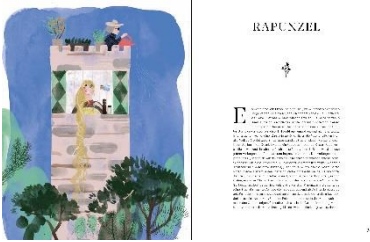
Illustration © Rinah Lang