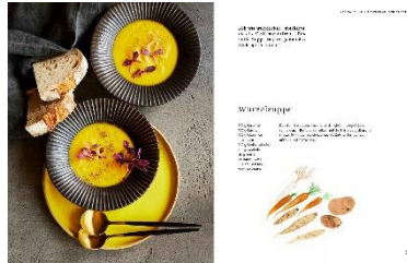
Wurzelsuppe Rezept © Kathleen Beringer, Illustration © Rinah Lang