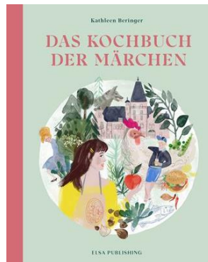
© Das Kochbuch der Märchen – Grimms kulinarische Welt, von Kathleen Beringer erscheint im November 2021 bei Elsa Publishing, 39,- EUR, www.elsapublishing.com