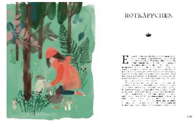
Illustration © Rinah Lang