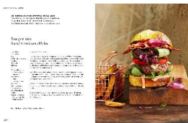
Burger mit Banditenkartoffeln Rezept © Kathleen Beringer