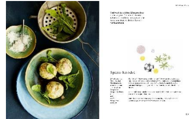
Spinatknödel Rezept © Kathleen Beringer, Foto © Katrin Winner, Illustration © Rinah Lang