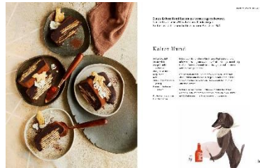
Kalter Hund Illustration © Rinah Lang, Kuchenrezept © Uwe Lindner / The Victorian House, 2021