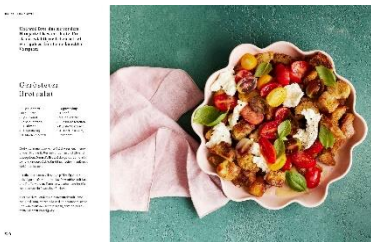
Gerösteter Brotsalat Rezept © Kathleen Beringer