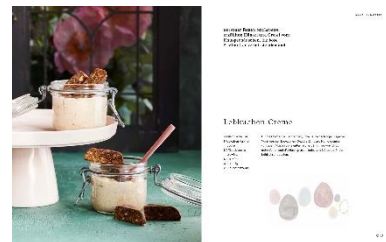
Lebkuchen-Creme Rezept © Kathleen Beringer, Foto © Katrin Winner, Illustration © Rinah Lang