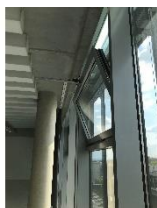
Foto 3: Stoßlüften unmöglich: Die Fenster in den MultiMedia Berufsbildenden Schulen Hannover lassen sich nicht öffnen, und die Oberlichter können nur gekippt werden. (Foto: Miele)

Foto 2: Ein Fernsehteam des NDR filmte die Miele-Luftreiniger für einen Bericht in der Sendung „Hallo Niedersachsen“. (Foto: Miele)