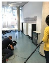
Foto 2: Ein Fernsehteam des NDR filmte die Miele-Luftreiniger für einen Bericht in der Sendung „Hallo Niedersachsen“. (Foto: Miele)

Foto 1: Insgesamt drei mobile Luftreiniger Miele AirControl ermöglichen in diesem Klassenraum wieder Präsenzunterricht, den sie mit einer Lautstärke von maximal 35 Dezibel nicht stören. (Foto: Miele)