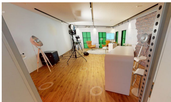
Blick ins JumuTV-Studio

Das Programm von „JumuTV“ wird im Vorfeld des Bundeswettbewerbs auf der Homepage www.jugend-musiziert.org veröffentlicht.