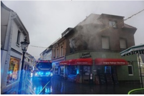
Einsatzstelle Becherner Straße