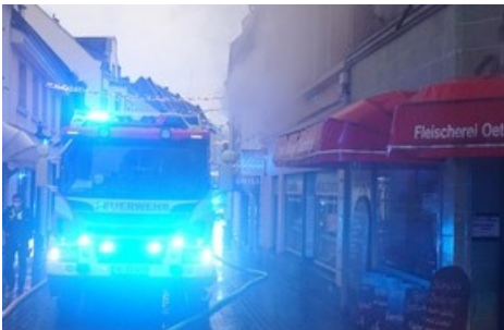
Rauchentwicklung aus dem Gebäude Bechemer Straße