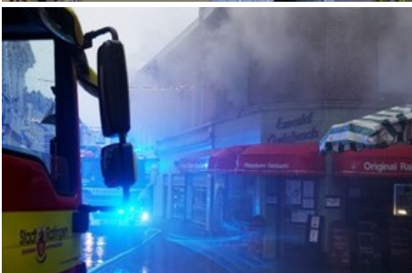
Einsatzstelle Bechemer Straße