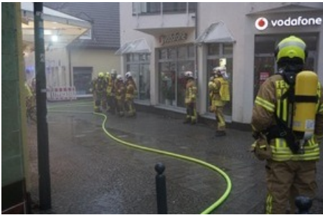
Einsatzkräfte an der Bechemer Straße