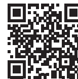
Videopräsentation (12 min)