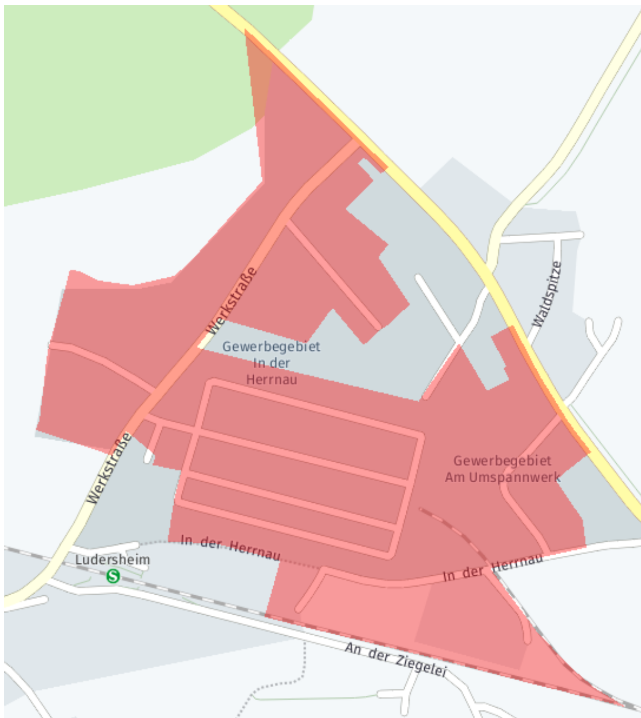
Karte der Stadt Altdorf bei Nürnberg: Ausbaubereich in den Gewerbegebieten in der Herrnau und am Umspannwerk