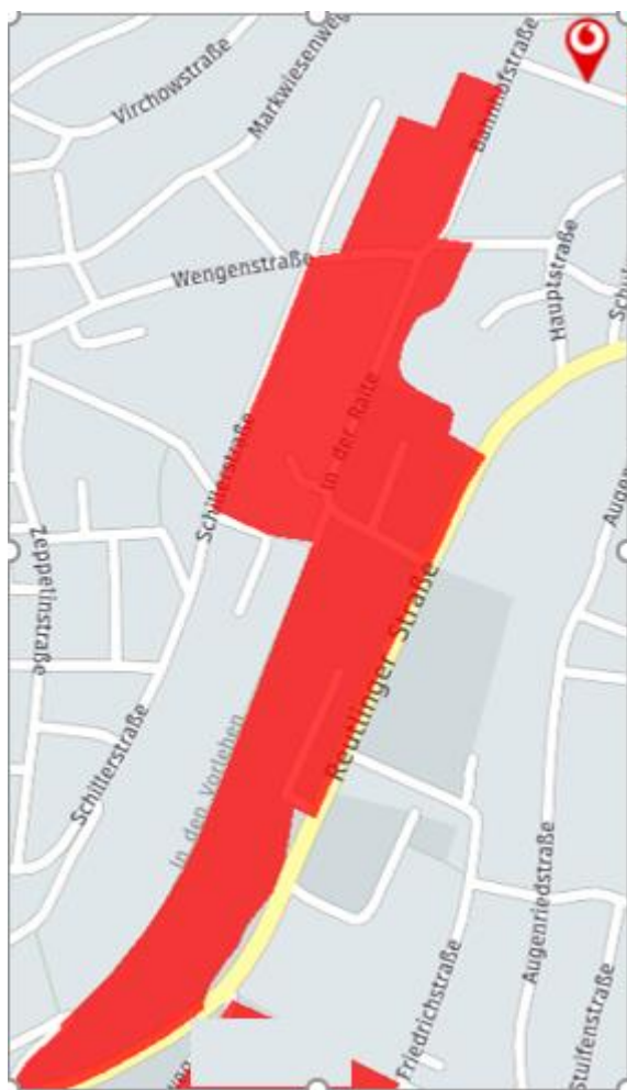
Ausbaukarte der Stadt